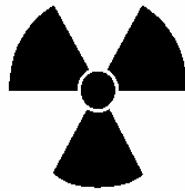
Gambar 1. Tanda Radiasi

Tanda Radiasi yang digunakan adalah sebagaimana pada Gambar 1.