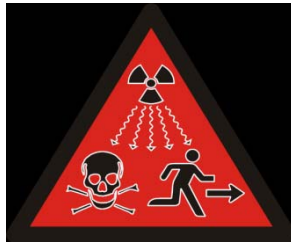
Gambar 3. Tanda Radiasi untuk Zat Radioaktif Terbungkus aktivitas tinggi

Untuk Zat Radioaktif Terbungkus aktivitas tinggi, selain menggunakan tanda Radiasi sebagaimana pada Gambar 1, juga dapat menggunakan tanda Radiasi sebagaimana pada Gambar 3 yang khusus ditempatkan pada wadah sumber radioaktif untuk Pesawat Terapi Eksternal.